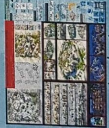
مصطفى أبو علي